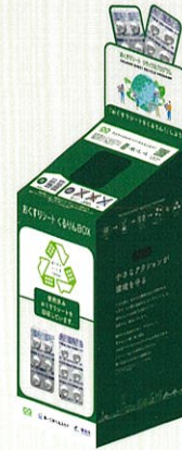
おくすりシートくるりんBOX イメージ

「おくすりシートくるりんBOX」では1枚より使用済みのおくすりシートの回収を受け付けております。